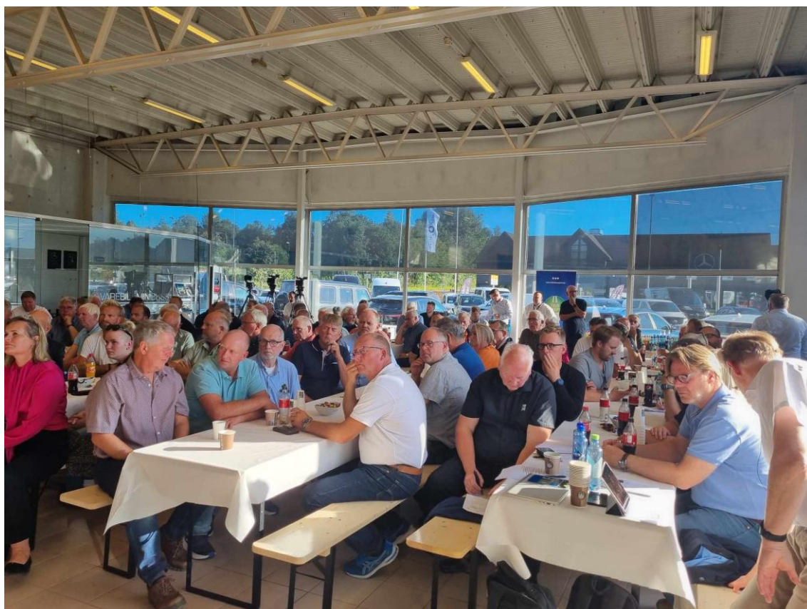
Deltakere fra region 3 pleier også finne veien til lastebilkvelden under Arendalsuka

Lastebilekveld Arendalsuka 14. august | Lastebil.no