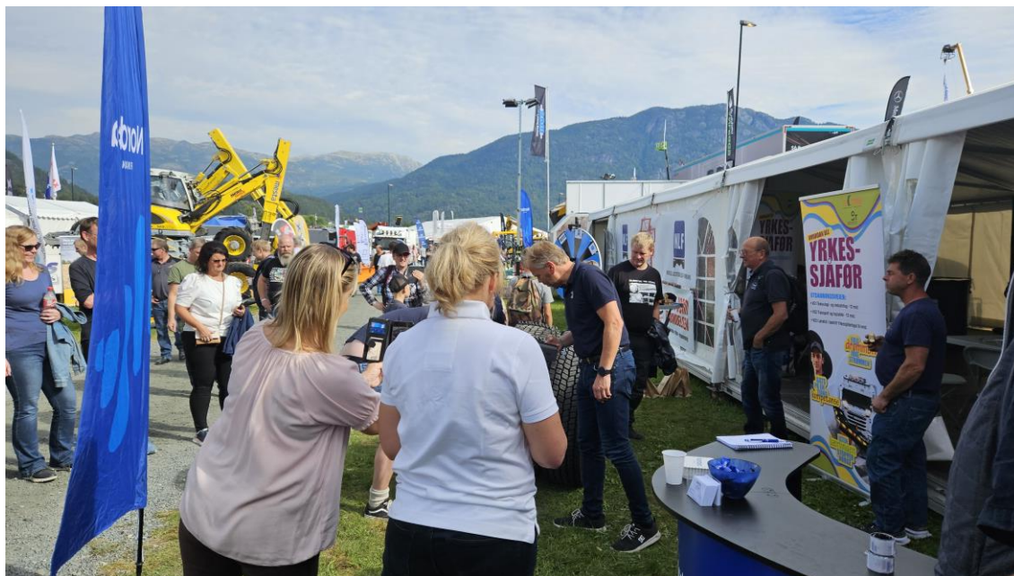
Livlig aktivitet på NLF sin stand på Dyrsku'n i fjor

Møt NLF på den tradisjonsrike handelsmessen 13. - 15. september. Folkefesten i Seljord har foregått siden 1866, og samler 800 utstillere og 90.000 besøkende.