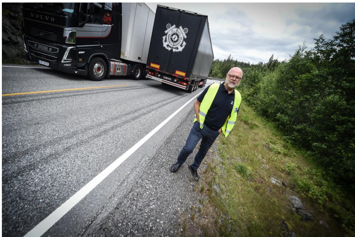
Trangt for lastebiler. NLF sin regionsjef ved flaskehalsen som nå skal ordnes.

Kobberbergselvabroen med fartshumper og 40 sone har vært et irritasjonsmoment for både næringstransporten og andre kjørende på E134 strekningen i mange tiår. Mange var hoderystende når det kom ny E134 gjennom Kongsberg med blant annet bro og tunnel i Saggrenda, og de stoppet fornyelsen rett før broen over Kobberbergselva.