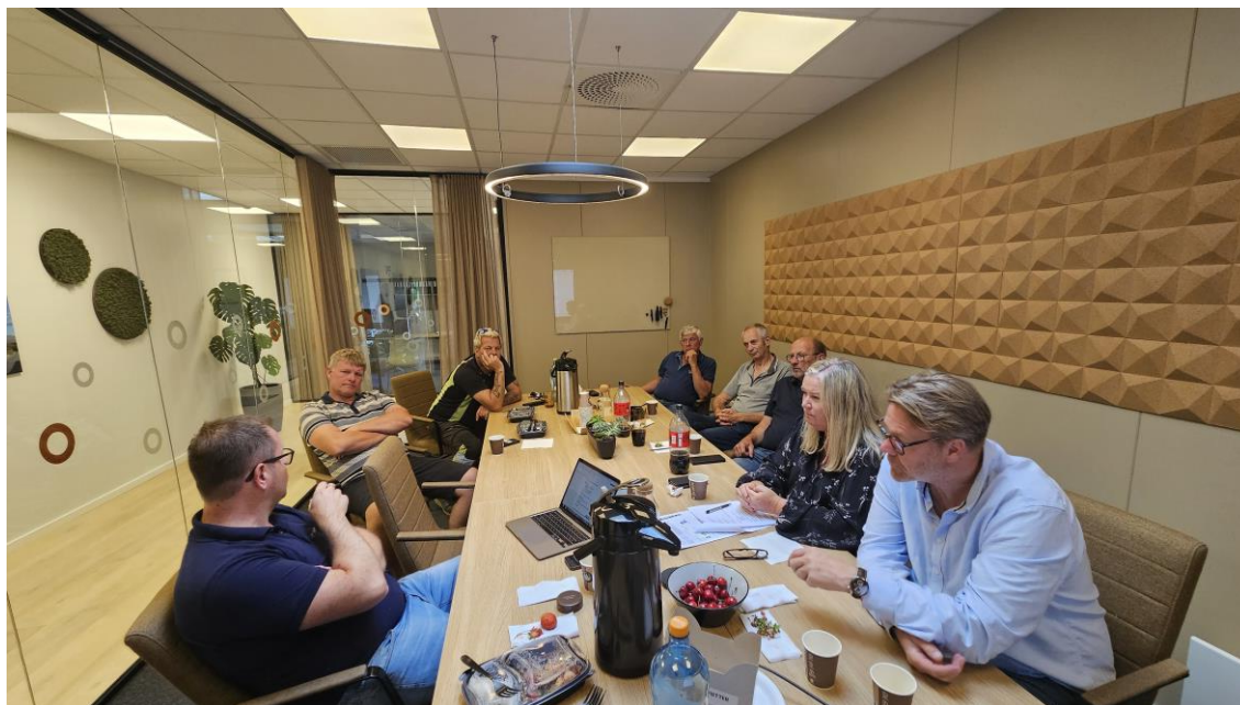
Friske diskusjoner i NLF Telemark

Av høstens aktiviteter som fylkesavdelingen har en nøkkelrolle i er blant annet studiereise til Polen og Dyrsku'n. I tillegg til aktivitetsplanlegging ble også høringsaker og andre faste styresaker behandlet.