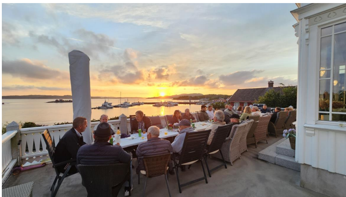
Lastebileiere i solnedgang. Det var nydelige forhold i Helgeroa

Deltakelse i NLF er ikke bare faglig og næringspolitisk viktig, men det byr også på en rekke sosiale og hyggelige sammenkomster med kolleger. I regionen har det denne sommeren vært fine tilstelninger i Helgeroa og på Ringerike.