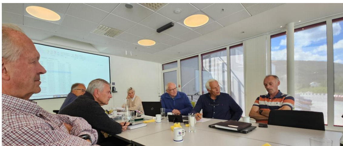
Fra møtet i Hallingplast sine lokaler på Ål

NLF representantene orienterte om utfordringer for norsk næringsliv med spesielt fokus på transportnæringen. I tillegg ble det gitt eksempler på godt lobbyarbeid og organisasjonsmodeller som har gitt gode resultater.