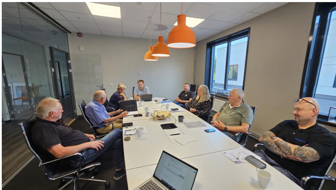
Gode diskusjoner i styret NLF Buskerud

Høringssaken om løyveplikt på nasjonal godstransport skapte engasjement. Andre høringssaker var om tunnelforskriften og endringer i betalingsforskriften for bompenger.